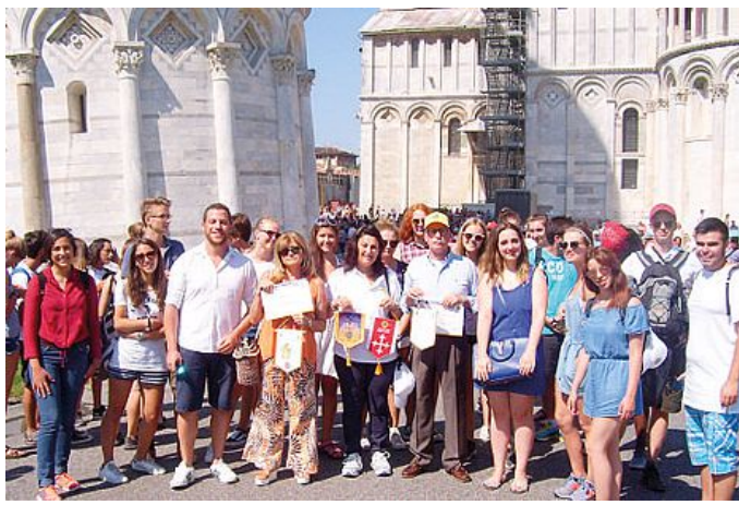
Il gruppo in visita a piazza dei Miracoli